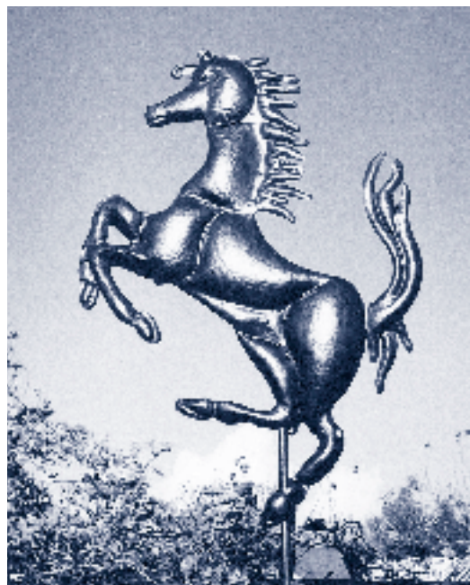
Obr. 36 – Firma Rigokov: Kovová plastika koně – symbol firmy, Dunajská Lužná 1998.

Tradice romského kovářství se stala základem pro tvorbu dnešních romských uměleckých kovářů . Snad jejich největší koncentrace je v oblasti západního Slovenska; romské umělecké kováře nalezneme mj. v Bratislavě-Podunajských Biskupicích, Zohoru nebo v Dunajské Lužné. V poslední jmenované obci funguje hned několik rodinných firem, např. Rigovci – Rigokov (viz obr. č. 36), Šarközi , ale i Šarközy (viz obr. č. 35), které nejen exportují své práce do zahraničí a do exkluzivních obchodů s bytovými doplňky i nábytkem, ale podílí se také na restaurování kovových objektů v historických částech Bratislavy (např. brána prezidentského paláce) nebo Vídně. Romští umělečtí kováři reprezentovali naši zemi v roce 1967 na mezinárodní výstavě EXPO v kanadském Montrealu. Za kovovou plastikou kozorožce si z výstavy odvezli dokonce významné ocenění. Je příznačné, že právě na této prestižní výstavě byl skutečný původ autorů zamlčen a díla byla vydávána za slovenskou lidovou tvorbu.