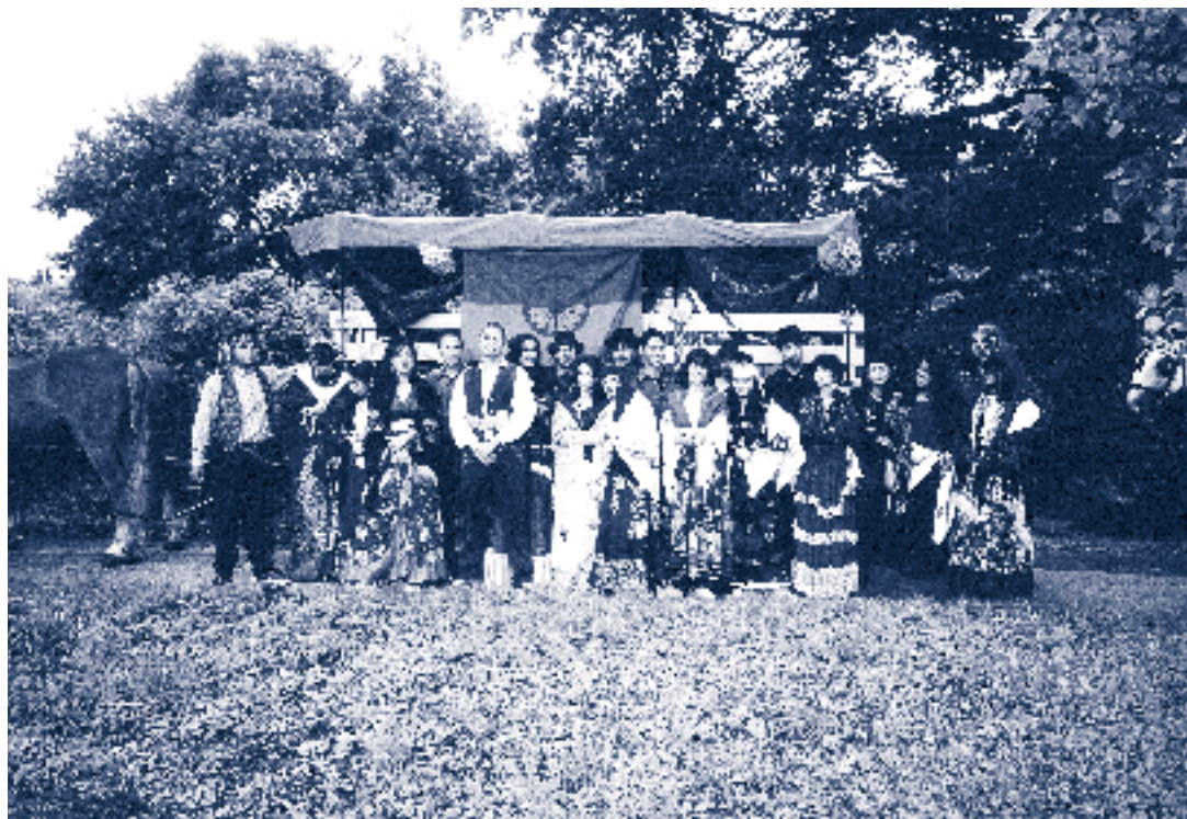
Obr. 33 – Romští studenti středních a vysokých škol z ČR sdružení v o.s. Athinganoi si připomněli něco z tradic svých předků a aspoň na několik letních dní okusili kočování, Kladruby, 2000.