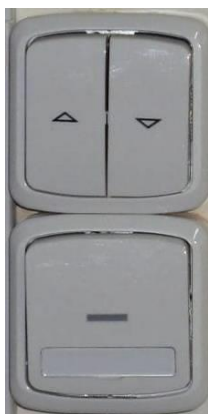
Obrázek číslo 1