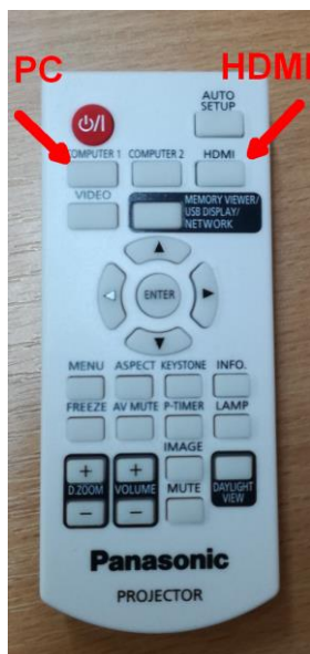
Obrázek číslo 2