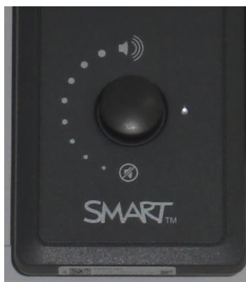
Obrázek číslo 3