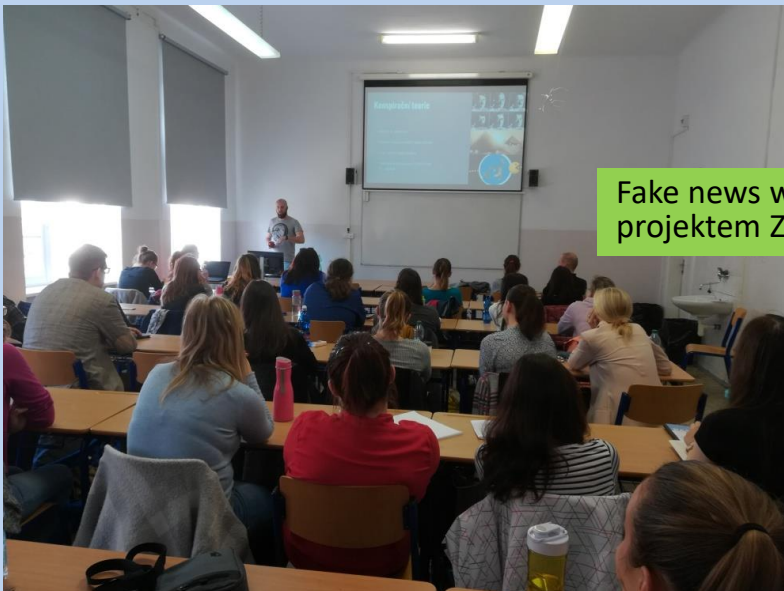
Fake news workshop s projektem Zvol si info