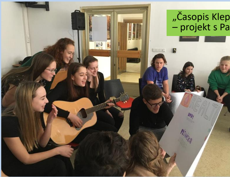
„Časopis Klepy a holocaust“ – projekt s Paměti národa JČ