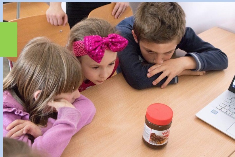
Studentský projekt „Escape game: ovládni supermarket“.