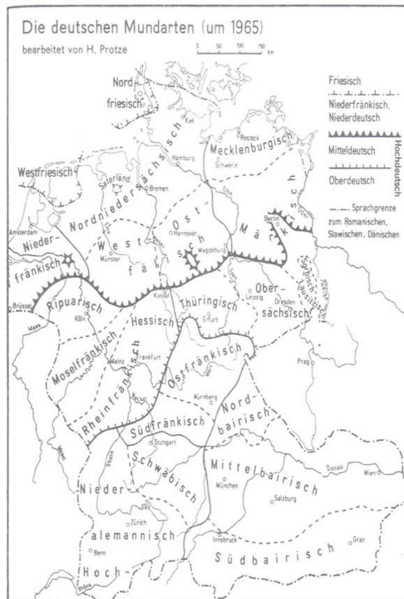
2. Die deutschen Mundarten - Übersicht B

Als Folge der historischen Voraussetzungen und als unmittelbare Perspektive dieser Studie ist in Erinnerung zu rufen, dass Wien mit einem Viertel der gesamten österreichischen Bevölkerung auf der Basis seiner jahrhundertelangen zentralen Stellung bis heute als das wichtigste Ausstrahlungszentrum des Landes zu betrachten ist. Dies hat aus linguistischer Sicht zur Folge, dass typisch österreichische Lautungen und typisch österreichischer Wortschatz meist von Wien ausgehen, und auch die städtischen Umgangssprachen des österreichischen Donauraumes und Ostösterreichs sehen Wien als ihr Vorbild. Insgesamt kann wohl die Behauptung aufgestellt werden, dass zwei Drittel, wenn nicht mehr, aller Österreicher in ihrem alltäglichen Sprachgebrauch mehrheitlich großräumige Nonstandardvarietäten verwenden, die als „wiennah“ einzustufen sind, wobei in der Forschungstradition der Wiener dialektologischen Schule häufig zwischen „Altwienerisch“ und „Neuwienersich“ unterschieden wird. Dabei ist das