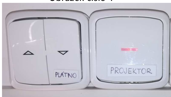
Obrázek číslo 1