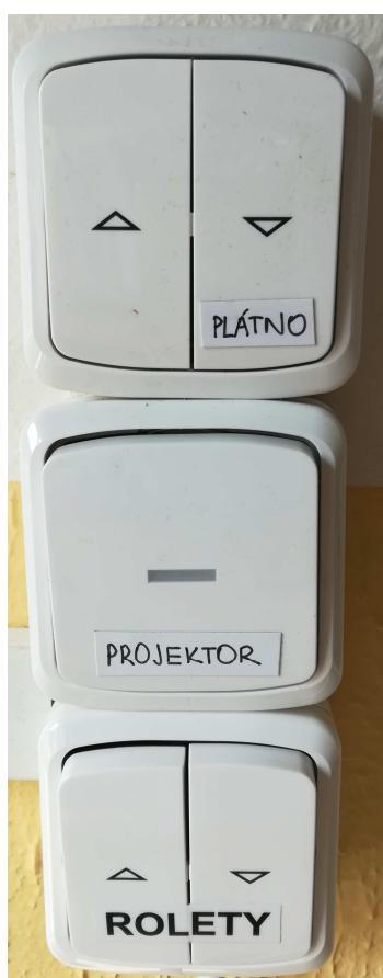
Obrázek číslo 1